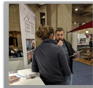
Figure 3. Rencontre avec un citoyen au salon national de l'habitation

Fière de sa participation au plus important salon de l'habitation de la province, Mérule pleureuse Québec en a profité pour faire connaître la mission de l'organisme, discuter de la problématique de la mérule pleureuse avec de nombreux citoyens (Figure 3), avec des propriétaires d'immeubles à revenus, des courtiers immobiliers, des entrepreneurs, des inspecteurs en bâtiment et avec différents représentants de l'industrie de la construction et de la rénovation. Aussi, plusieurs nouveaux membres sympathisants ont adhéré à l'organisme pendant l'événement.