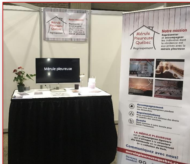
Figure 1. Kiosque et matériel promotionnel au salon national de l'habitation, mars 2019

Lors d'un événement, il apparaît important à l'organisme que les gens intéressés repartent avec un encart de l'organisme. Ce sont donc deux mille (2000) dépliantes sur un papier de qualité supérieure qui ont été produits. Ces encarts ont un double rôle puisqu'ils présentent l'organisme en plus d'agir comme carte professionnelle, les coordonnées de l'organisme y sont inscrites.